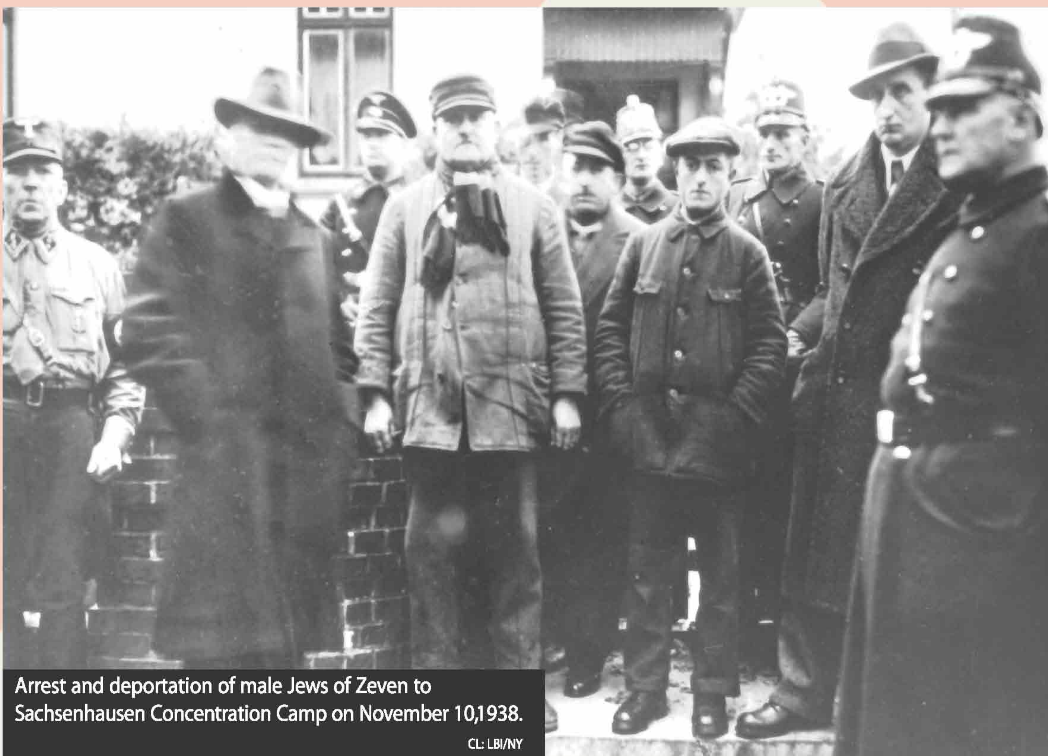
Arrest and deportation of male Jews of Zeven to Sachsenhausen Concentration Camp on November 10, 1938.