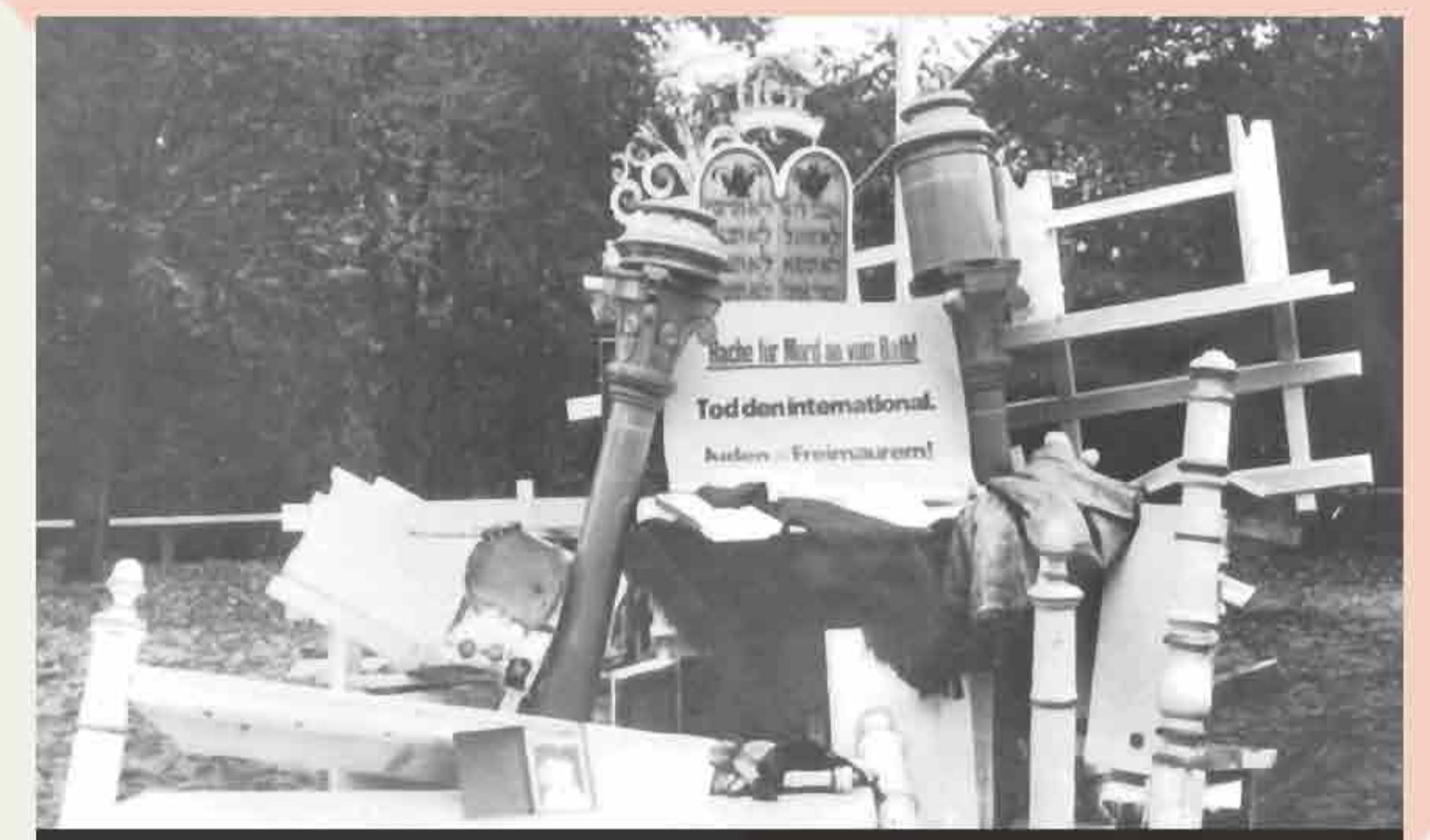
The looted interior of the synagogue at Zeven dumped onto the town's main square and later burned.