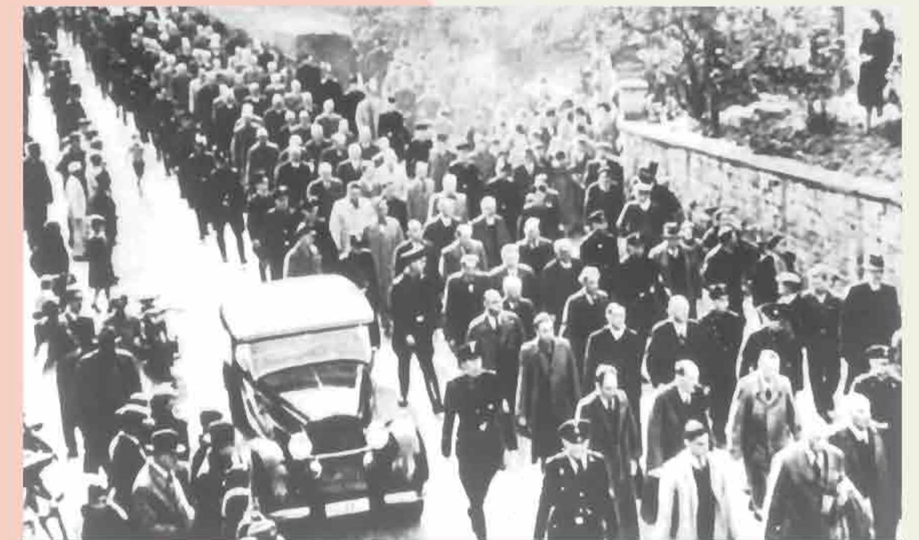
Deportation of male Jews of Berlin to Sachsenhausen Concentration Camp on November 10, 1938

As revenge for vom Rath's murder, Joseph Goebbels coordinated a nationwide night of antisemitic terror, subsequently known as Kristallnacht (Night of Broken Glass). On the night of November 9, 1938, synagogues were burned, Jewish shops looted, Jewish homes vandalized. Jews were beaten and abused. Ninety-one were murdered and 30,000 Jewish men were arrested and sent to concentration camps.